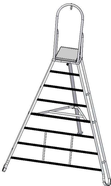
Állványmagasság: 2000 mm (L=2000) Cikkszám: 92110013