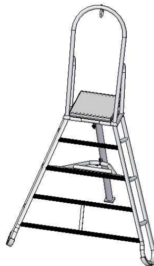
Állványmagasság: 1200 mm (L=1200) Cikkszám: 92110015