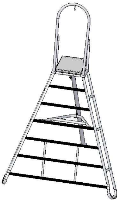
Állványmagasság: 1650 mm (L=1650) Cikkszám: 92110014